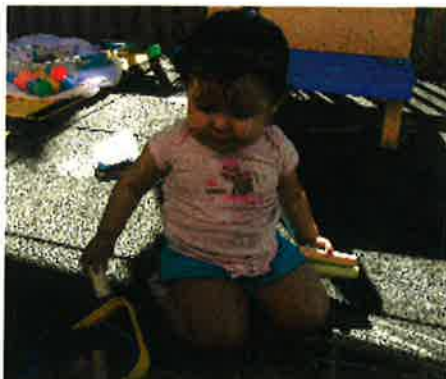
Aaliyah—Pink, Green or Orange