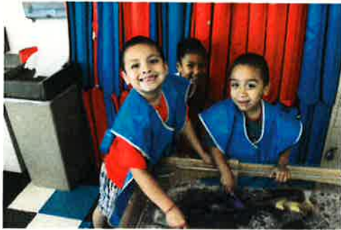
We love to play with the water