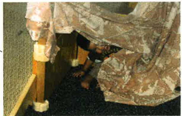
Malik—Can you see me?