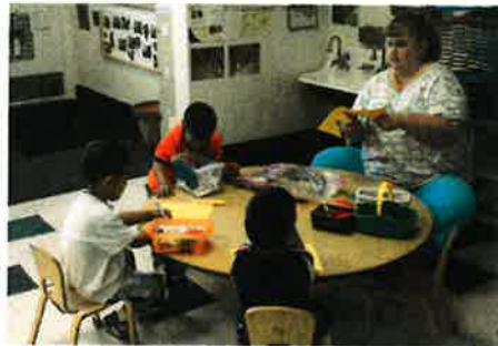
We are doing crafts