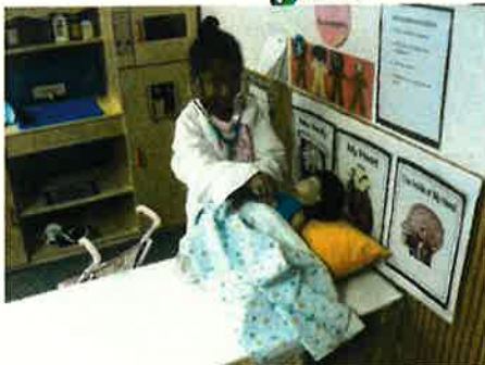
I am doing a check-up