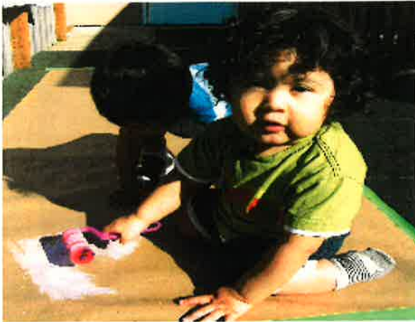
Gianny—Roll & roll my paint